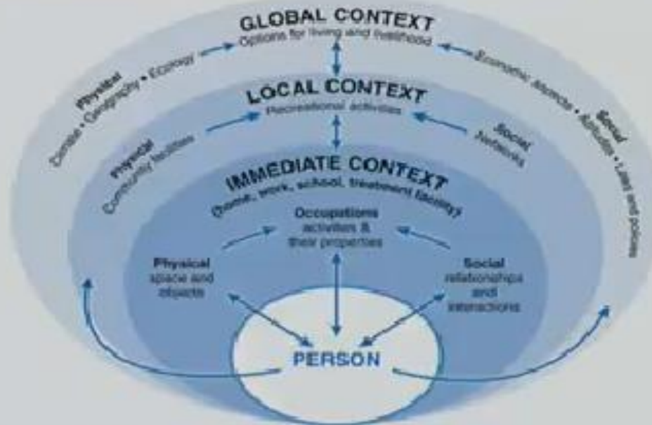
FIGURE 7-2 Examples of Items Included in the Physical, Social, and Occupational Environment across Three Contexts.

5 th Edition: Environment and Human Occupation Gail Fisher, Sue Parkinson & Lena Haglund